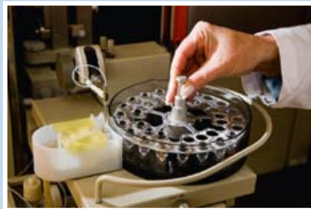
Bestückung eines Autosamplers

Wir sind von der Deutschen Akkreditierungsstelle Chemie GmbH als fachlich kompetentes Prüflabor bestätigt und eine zugelassene Trinkwasseruntersuchungsstelle in Niedersachsen. Mit moderner Technik und dem Know-how unserer Mitarbeiter können wir Ihnen als ortskundiger Partner für alle Fragen der Wasseranalytik zur Seite stehen.