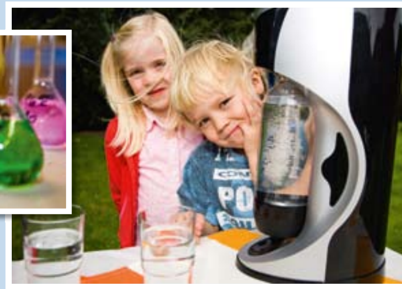
Eine klare Sache: Das Osnabrücker Trinkwasser ist gut und schmeckt gut!